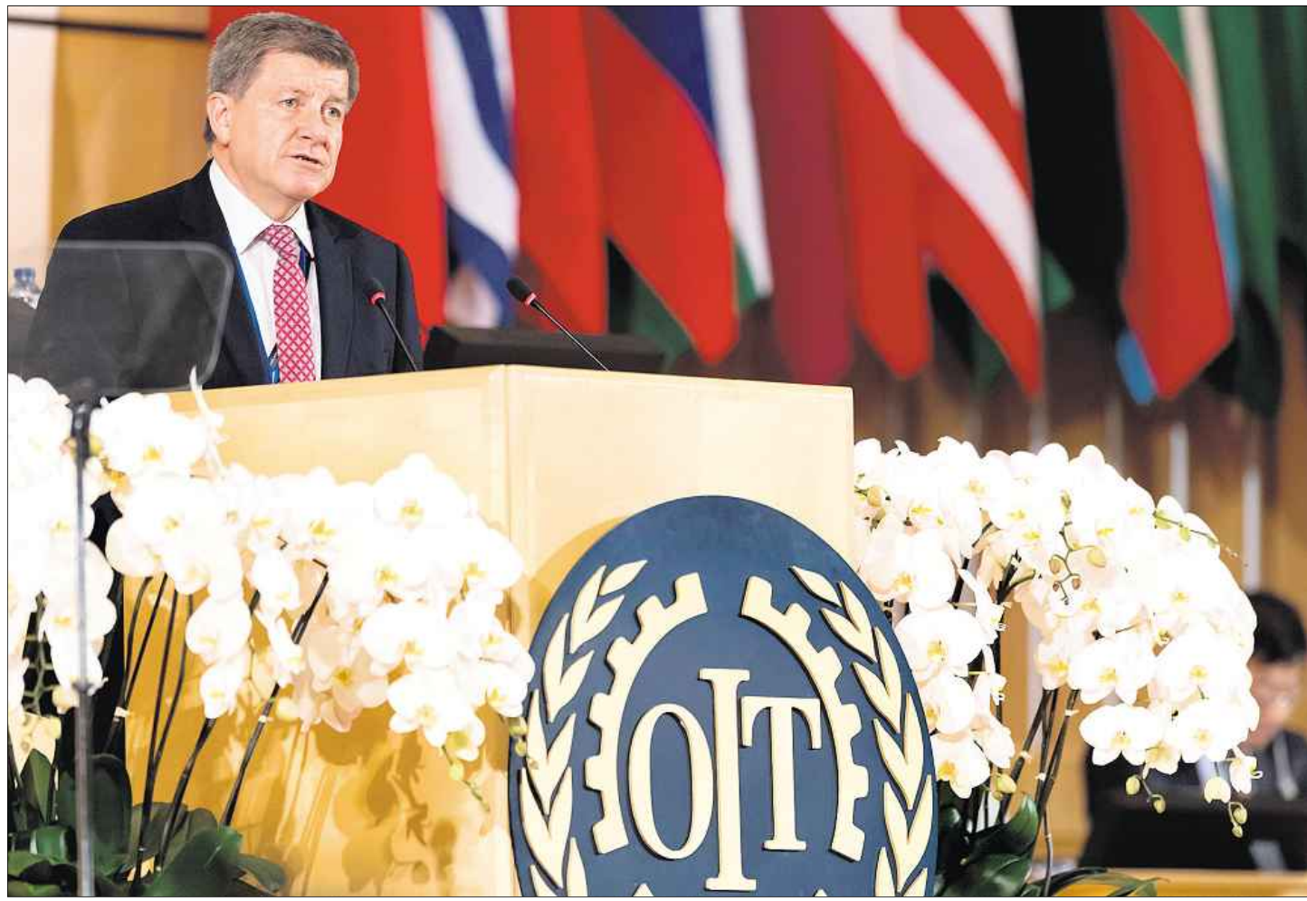
APERTURA. El director de la OIT, Guy Ryder, inaugura las reuniones en las que participan 5.000 delegados de gobiernos, sindicatos y entidades empresariales.