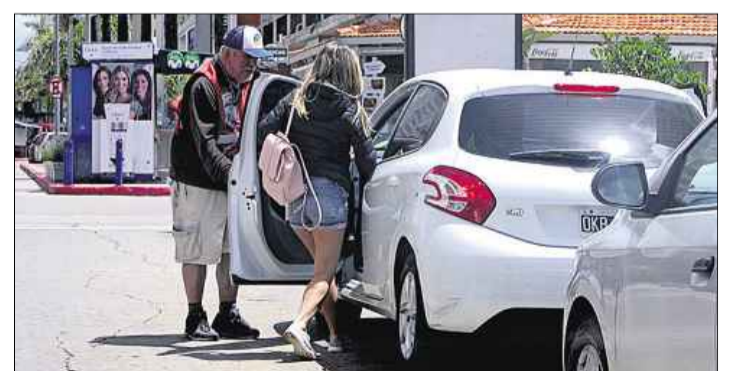
MEDIDA. Los cuidacoche tendrán límites en su actividad.

La comuna también establece que los cuidacoche no trabajan para la administración, y que deben aclararlo en caso que se les pregunte o que sea necesario. CIUDADES / A6